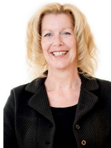
Elles Doesburg Uw financieel adviseur

Maandag: 09:00 - 17:30 Dinsdag: 09:00 - 17:30 Woensdag: 09:00 - 17:30 Donderdag: 09:00 - 17:30 Vrijdag: 09:00 - 17:30 Zaterdag: Gesloten Zondag: Gesloten Buiten openingstijden op afspraak